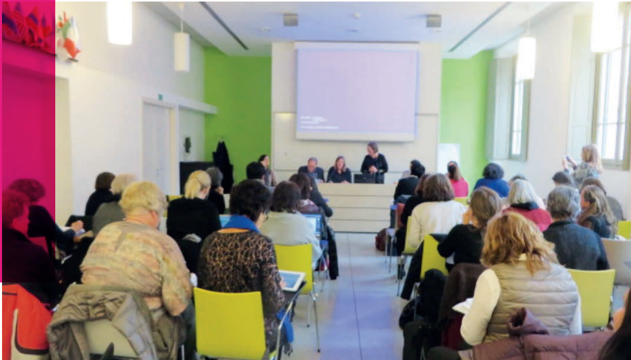
Loris Malaguzzi-centret i Reggio Emilia