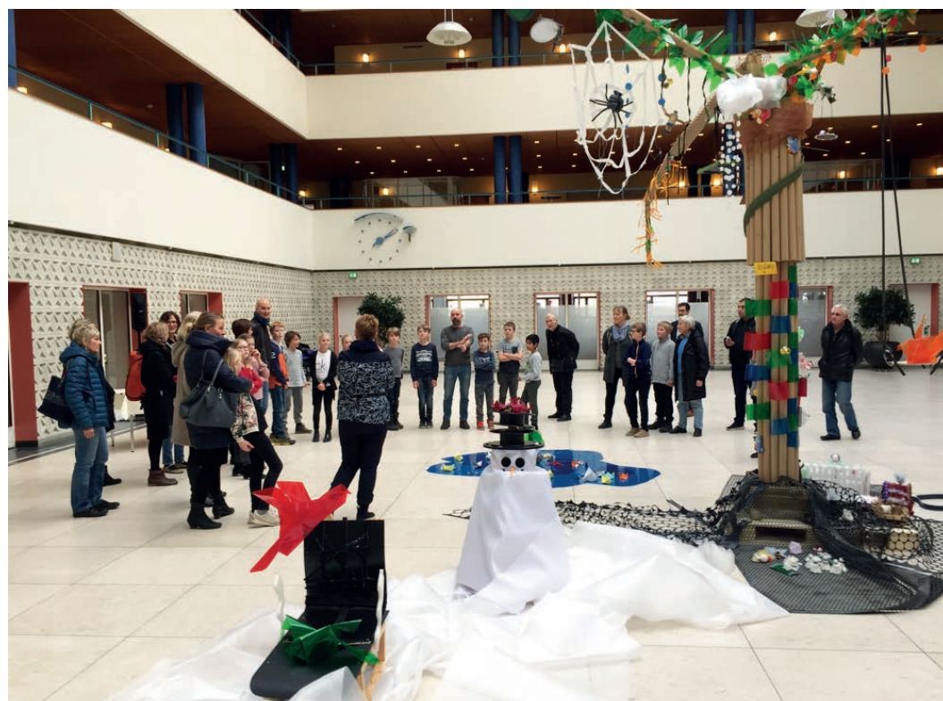
Træet med beboere i og omkring træet på plads i Rådhushallen klar til åbningsreception

Tre Odense skolers SF02'er fra Ejerslykke-, Munkebjerg- og Hunderupskolerne blev enige om at etablere et samarbejde, så børnene kunne få kendskab til andre børn, andre skoler og den kultur, de hver især havde.