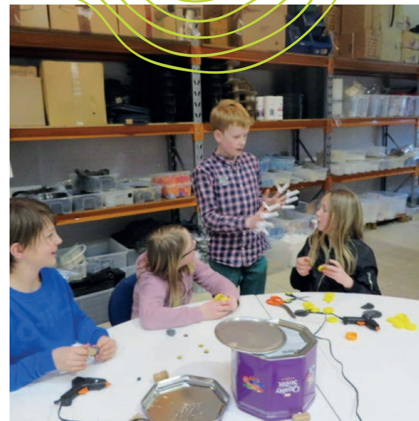
Gruppen arbejder sammen

Omkring træet var der en skaterbane til børn. Træet kunne spejle sig i en nærliggende sø og det fik desuden besøg af en snemand. Vi fik sne i arbejdspe-