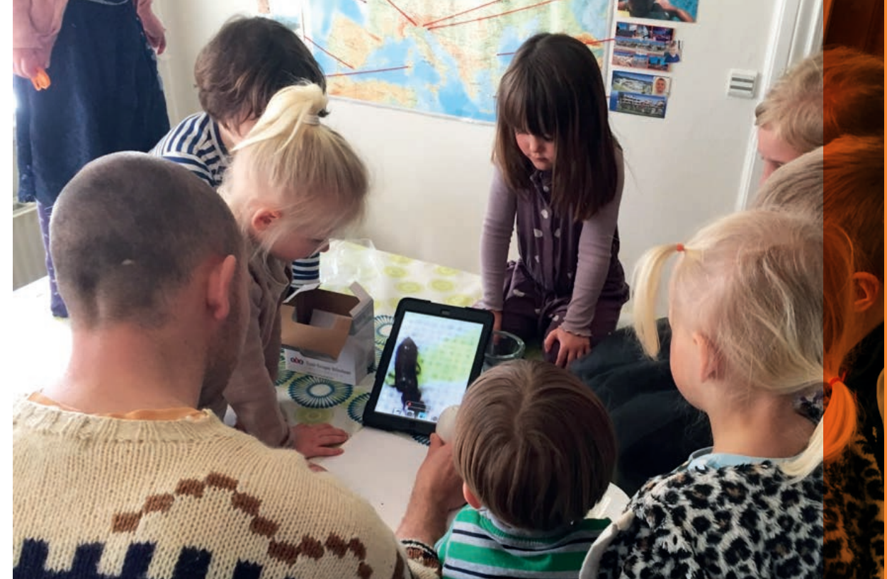
Børn studerer en bille på det digitale mikroskop

Alle rum på Grangård er delt i zoner. Zonerne er synlige enten ved hjælp af et møbel eller gulvbeklægning. Rummene er foranderlige afhængig af hvilke børn, der er i gruppen lige nu, udfordringer, ressourcer, næste skridt og hvilke emner vi arbejder med. Vi fordeler zonerne således at børnene må gå til eller igennem andres grupperum for at