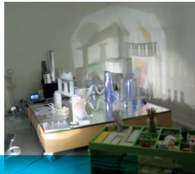
Scenarie fra skolen i centret

Her ligger nok også en del af forklaringen på, at det har vist sig så svært andetsteds at genskabe det, de laver i Reggio. Det kræver meget, og når det lykkes i Italien, skyldes det selvfølgelig Malaguzzi, et geni, hvis tanker, energi og udstråling fik bygget et system op, så stærkt, at det overlever i bedste velgående 25 år efter hans alt for tidlige bortgang.