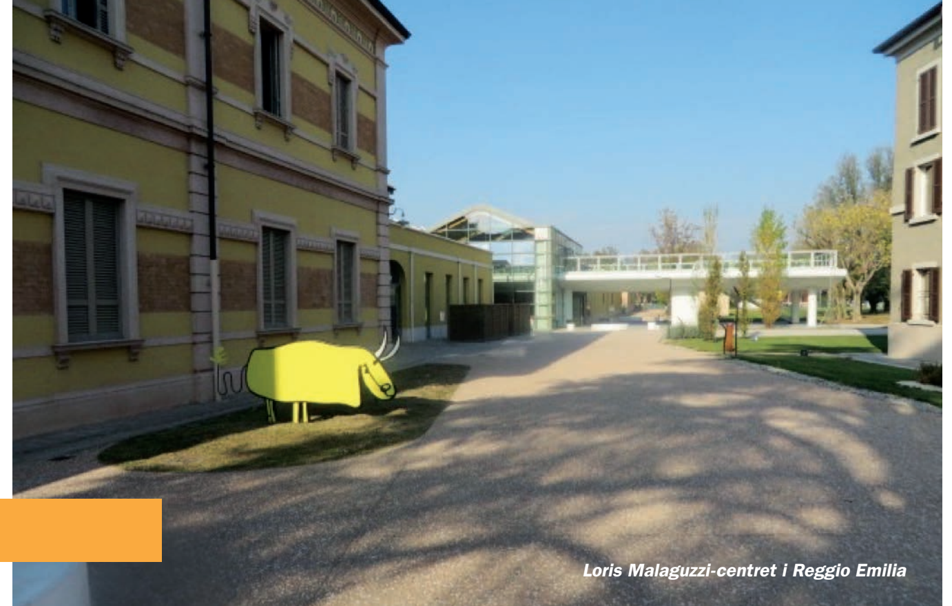
Loris Malaguzzi-centret i Reggio Emilia

Jeg er speciallærer for børn med særlige behov og har siddet i bestyrelsen for Reggio Emilia Netværk Danmark indtil april 2018.