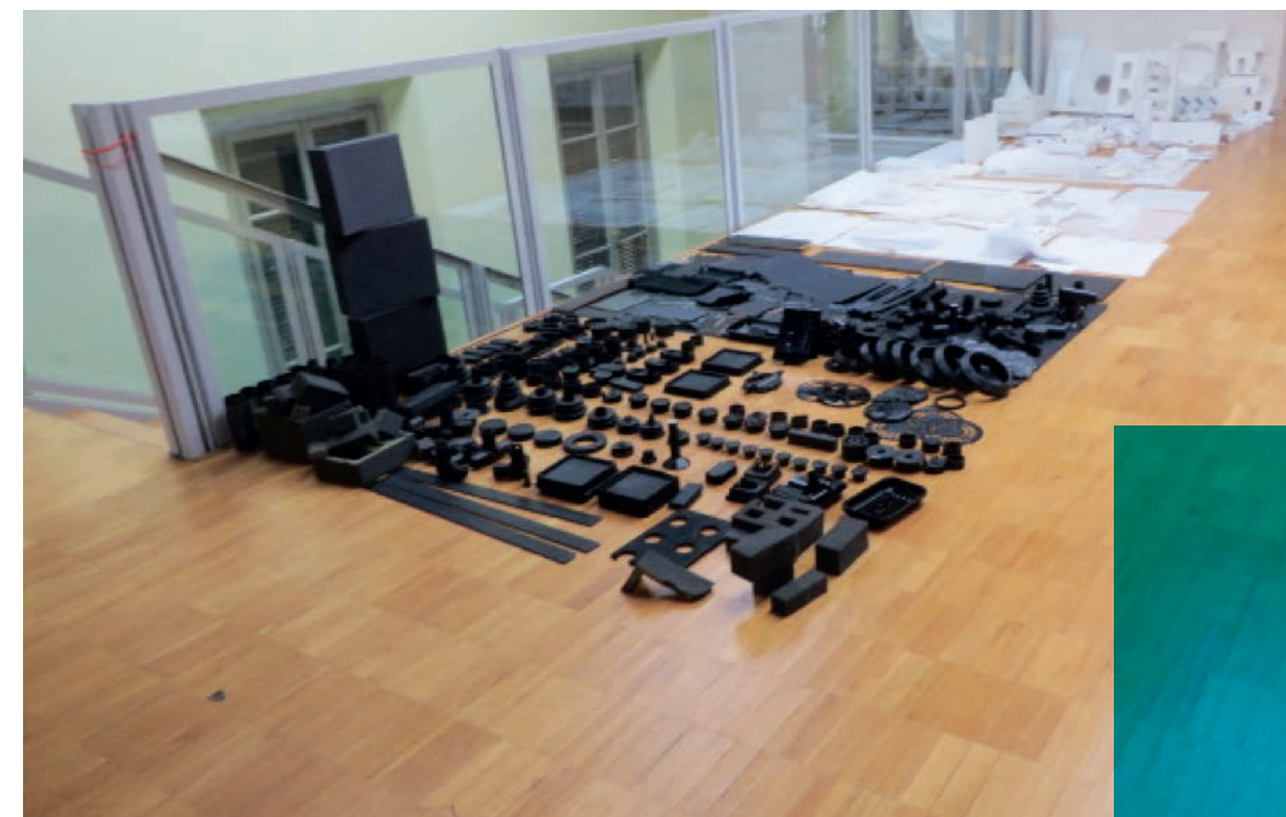
Præsentation af sorte og hvide materialer i Malaguzzi-centret

Det spændende for mig som psykolog har været, at denne pædagogik faktisk kan omsættes i en dansk hverdag, og at der med supervision og fokusering på observation, dokumentation som afsæt for pædagogisk handling findes redskaber til inklusion. Og det har især været en fornøjelse at se, hvordan pædagogen/læreren har bevæget sig fra frustration til stolthed over pædagogisk handling.