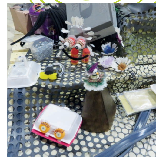
Dyr ved træets rod